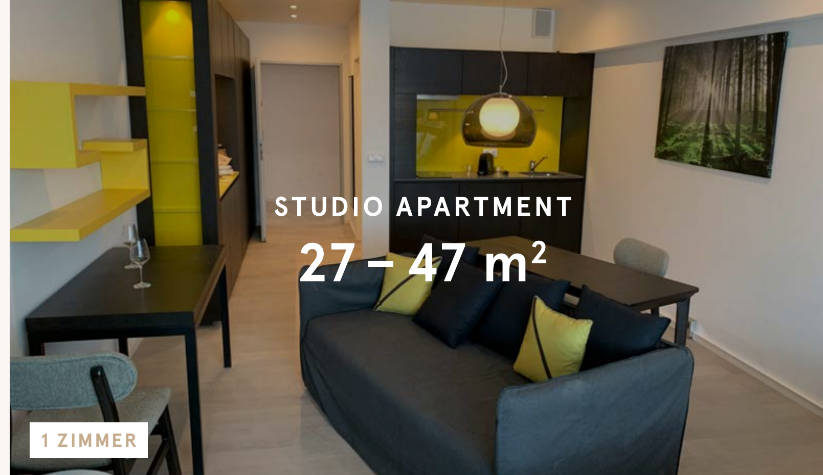
STUDIO APARTMENT 27 - 47 m 2