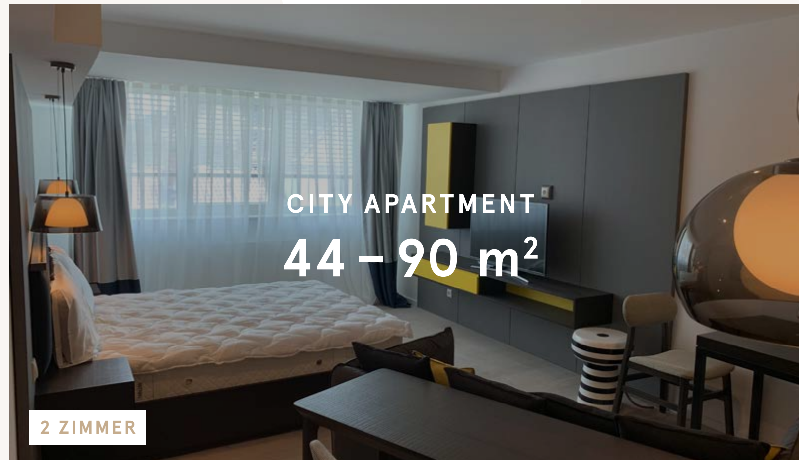
CITY APARTMENT 44 - 90 m 2